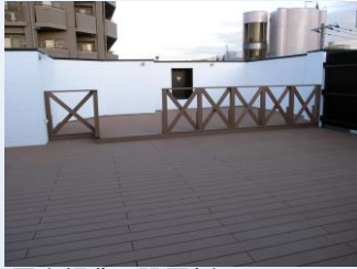
屋上緑化の設置例