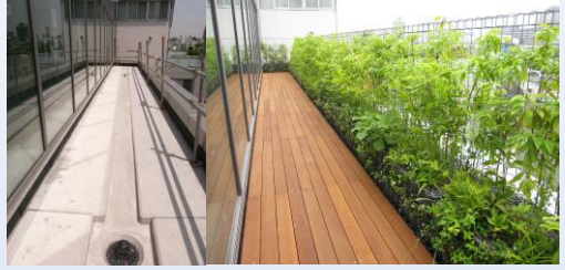
ペランダ緑化の設置例